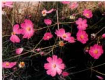
吉村芳生画「コスモス」(F80号)