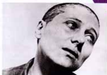
「裁かるるジャンヌ」

「シリーズ 映画史を読み解く #3」 映画上映+レクチャー カール・テオドール・ ドライヤー監督特集